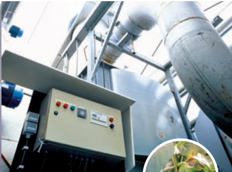
Als het gaat om CO 2 is alleen 100% zekerheid genoeg